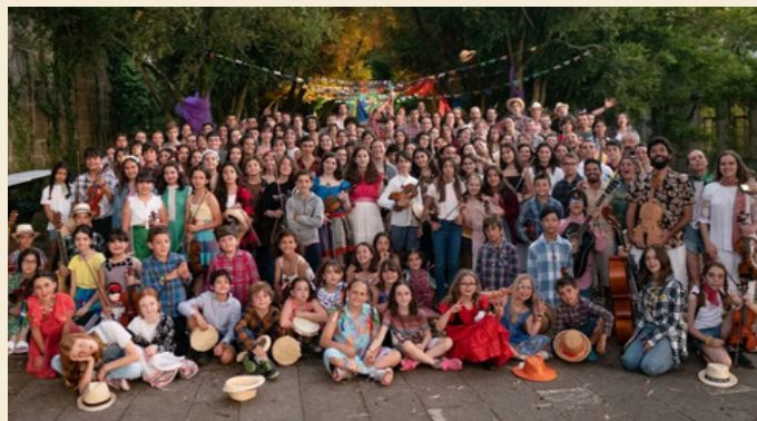
Todos los participantes del SSFC

Este verano he vivido una experiencia fantástica, en el San Simón Fiddle Camp de Galicia Fiddle. Un grupo de chic@s de todas las edades nos juntamos en la isla de San Simón para pasar una semana aprendiendo sobre la música tradicional de Brasil. Al llegar, nos recibieron con música y a partir de ahí no nos separamos de ella. Por las mañanas nos dividíamos en grupos y cada profesor nos enseñaba una pieza distinta. Eso sí, sin partituras, todo de oído. Así era más fácil de aprender. Era una música muy distinta a la que solemos estudiar, más divertida y pegadiza.